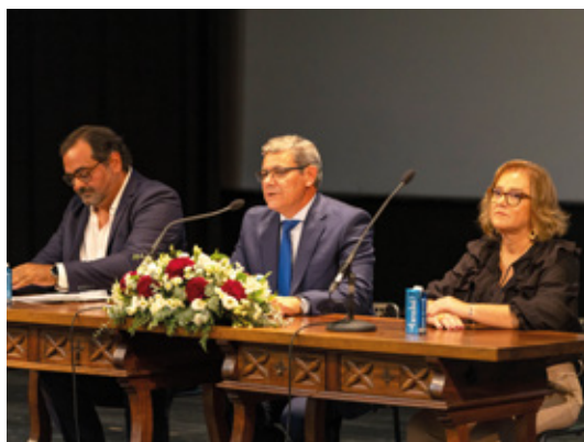
Mesa da Assembleia Municipal eleita