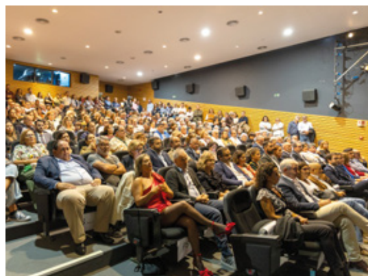
Plateia repleta assistiu à instalação dos órgãos autárquicos