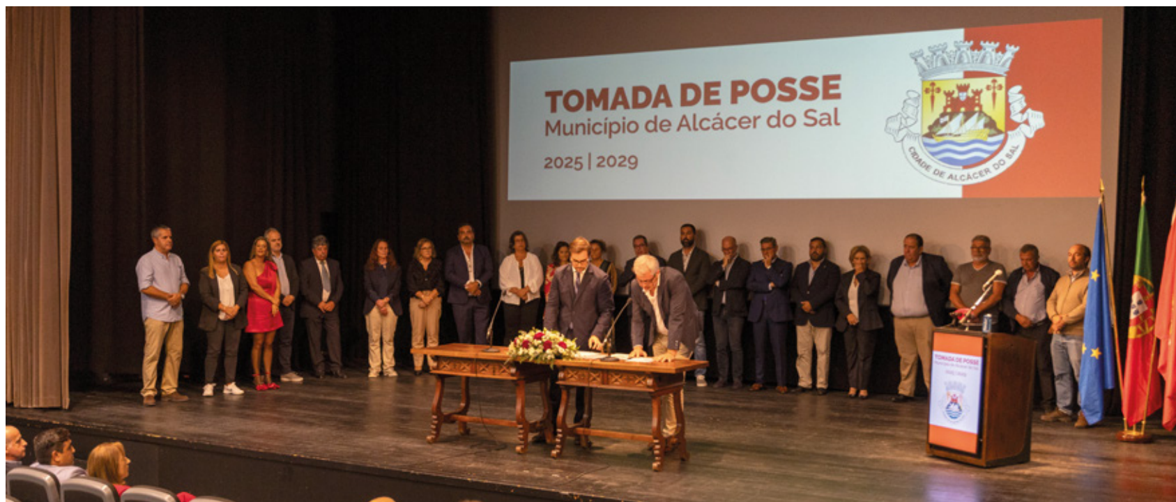
Instalação da Assembleia Municipal ocorreu a 28 de outubro, no Auditório Municipal de Alcácer do Sal